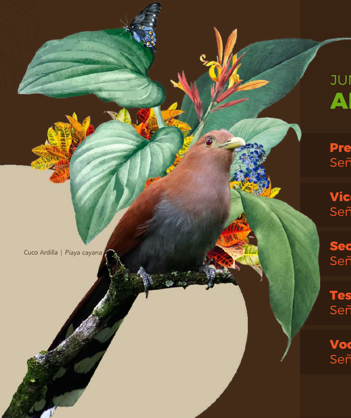
Cuco Ardilla | Piaya cayana