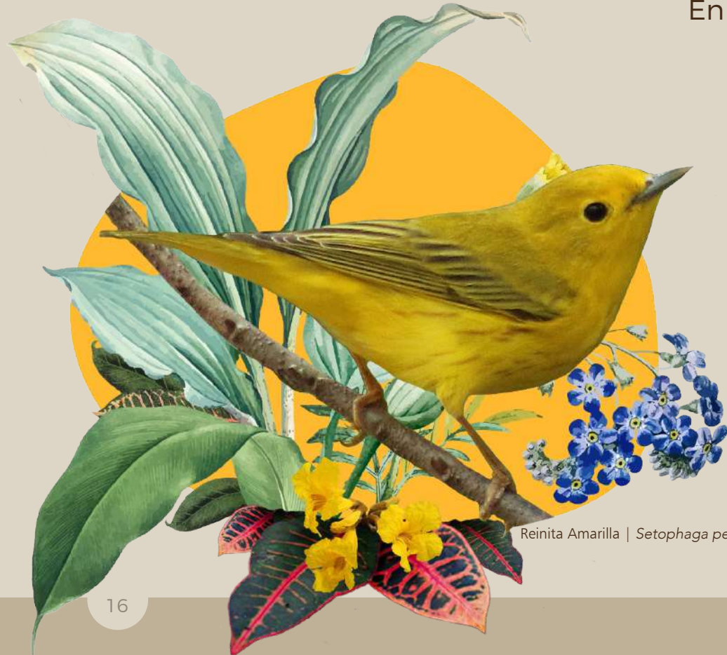
Reinita Amarilla | Setophaga petechia

Todos estos servicios son proporcionados por profesores, estudiantes de posgrados y proyectos de Trabajo Comunitario Universitario (TCU). La atención se virtualizó durante la pandemia lo que permitió beneficiar a más de 1200 personas .