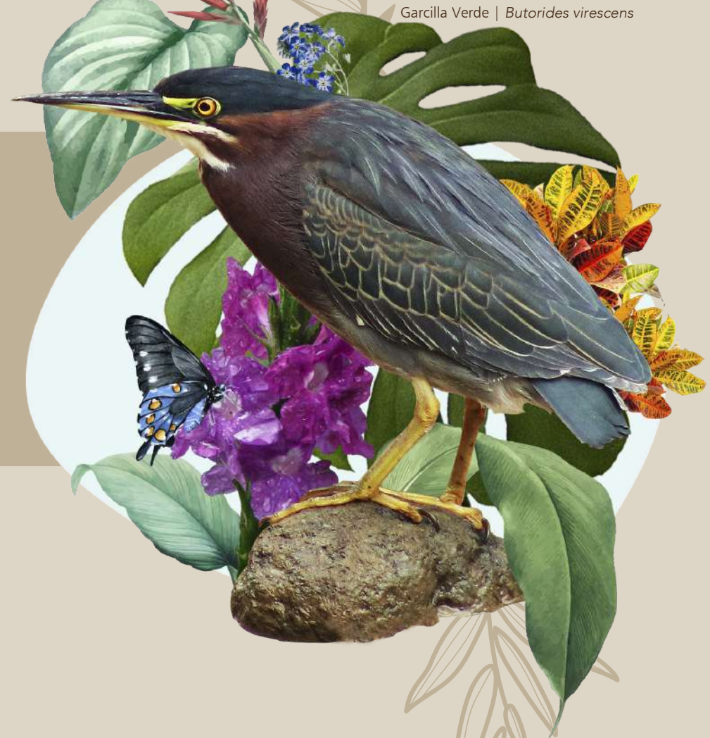
Garcilla Verde | Butorides virescens