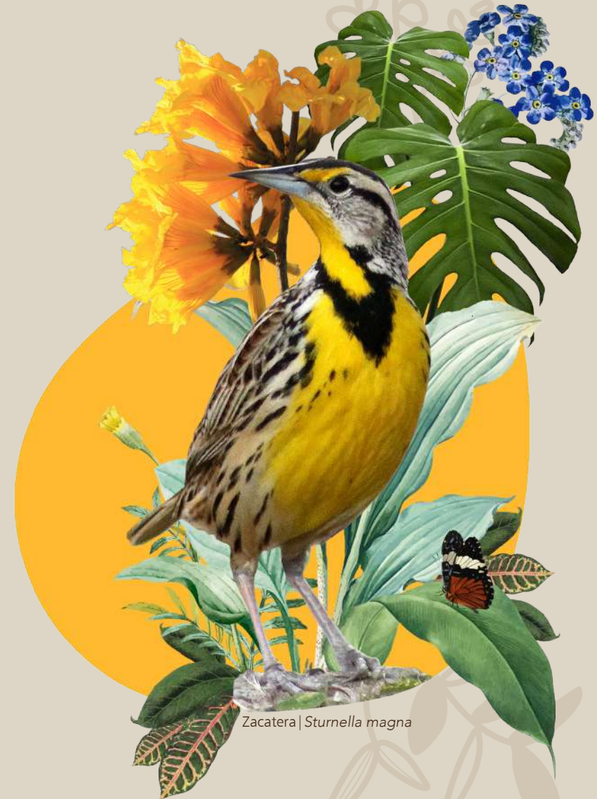
Zacatera | Sturnella magna

Día de la Familia, Día de las Madres, Turno Típico y Celebración de la Temporada Navideña, Softwares libres de Diseño, Ejercicios, Ambiente.