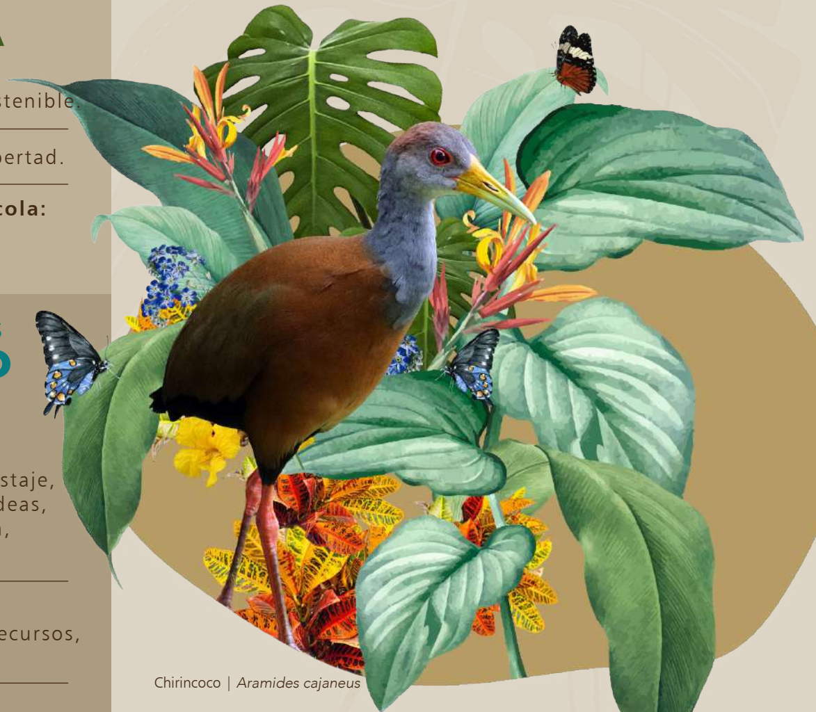
Chirincoco | Aramides cajaneus