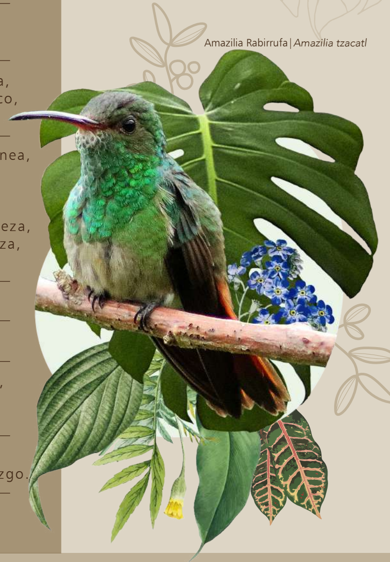
Amazilia Rabirrufa | Amazilia tzacatl