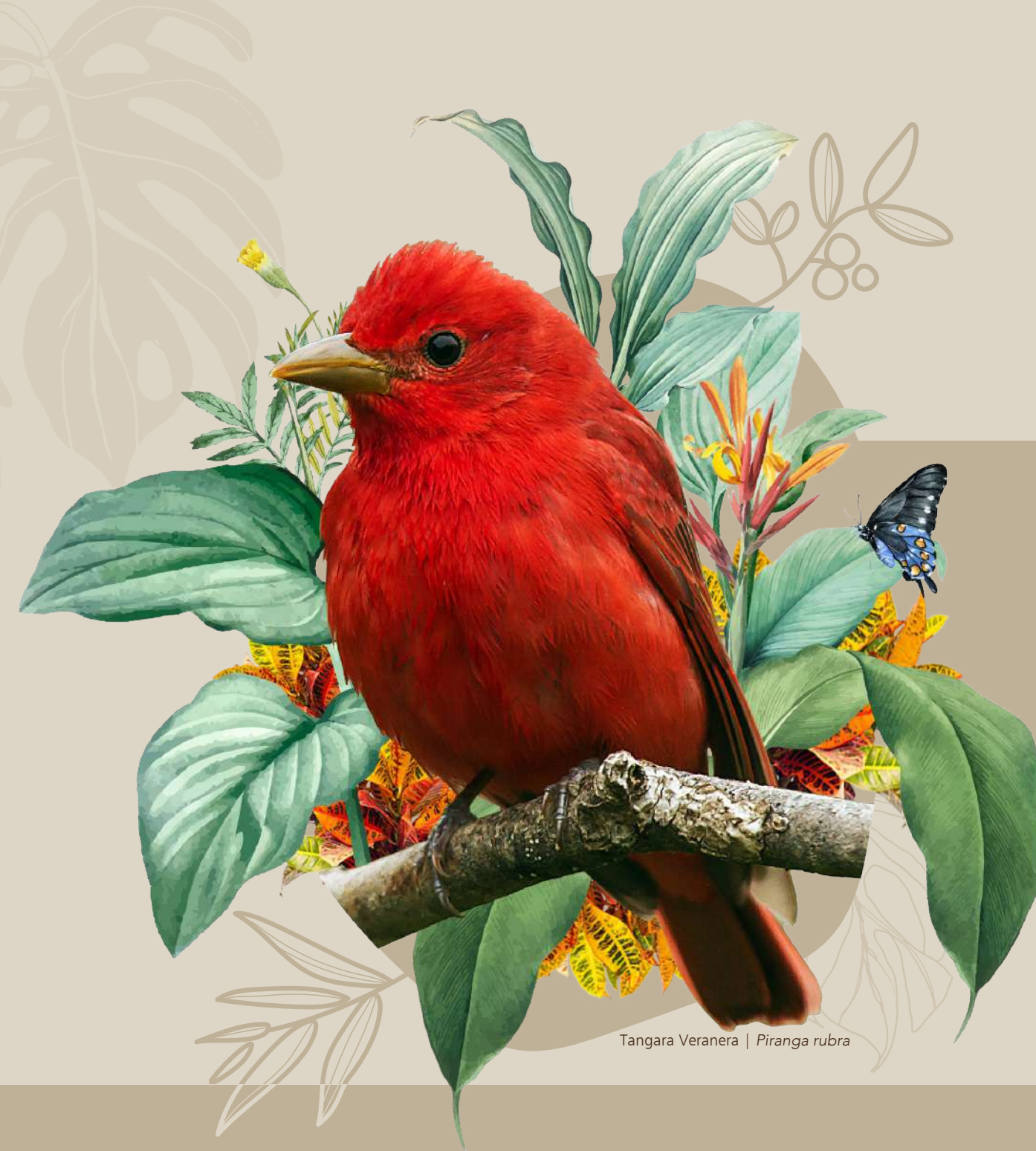
Tangara Veranera | Piranga rubra