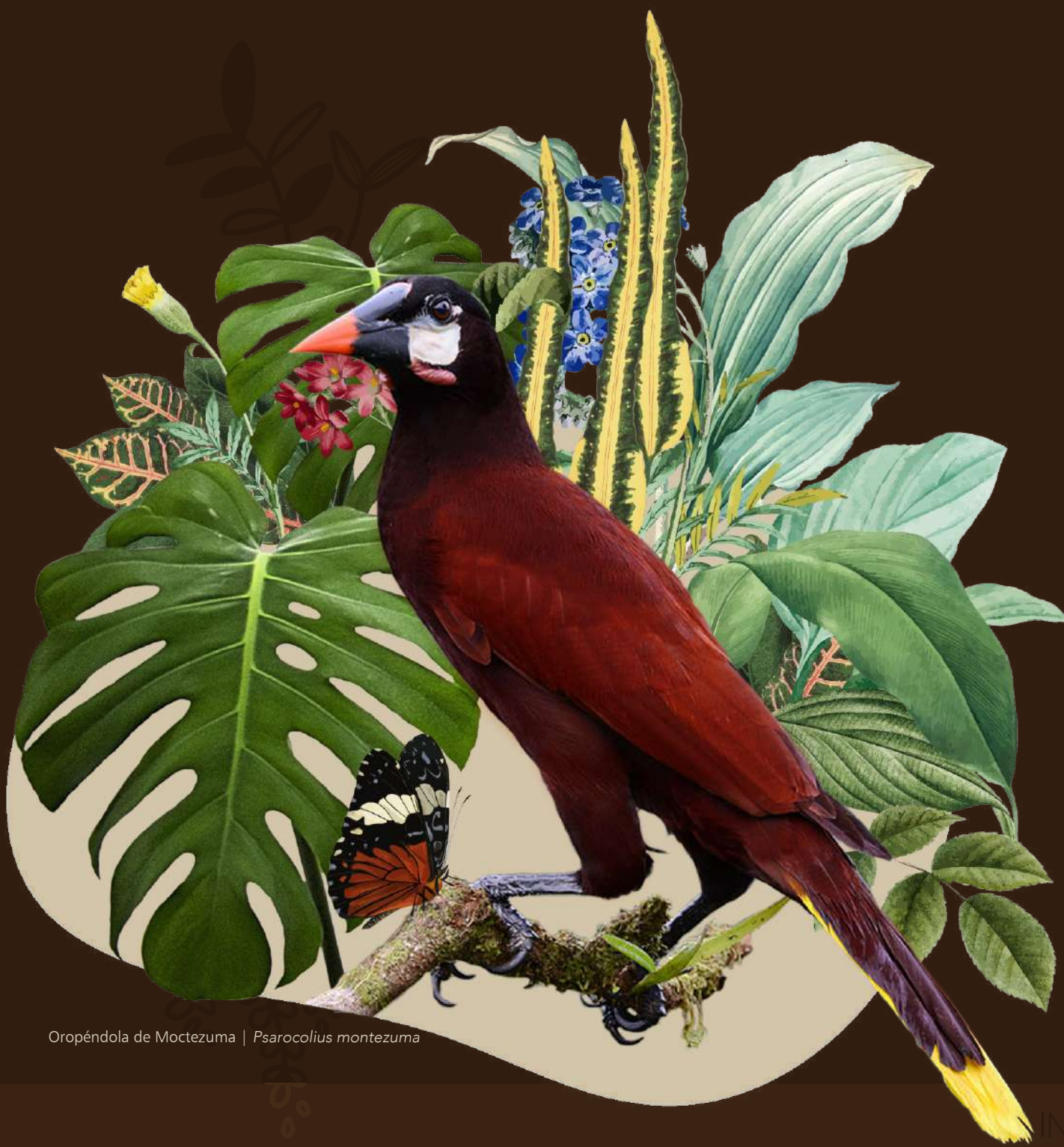
Oropéndola de Moctezuma | Psarocolius montezuma