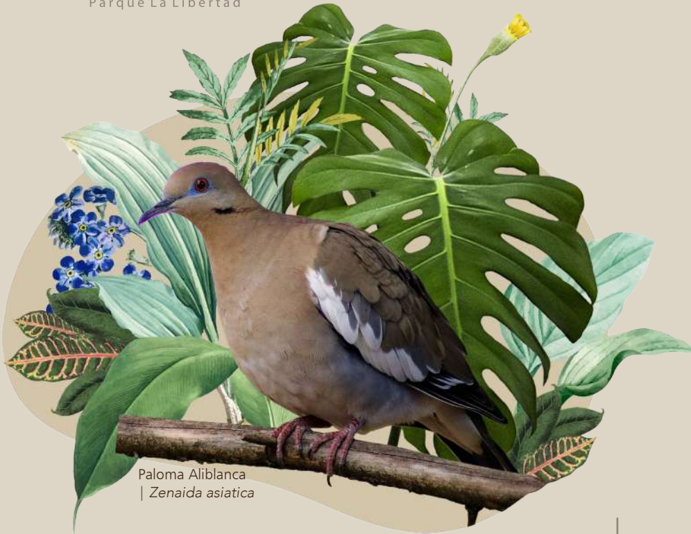
Paloma Aliblanca | Zenaida asiatica