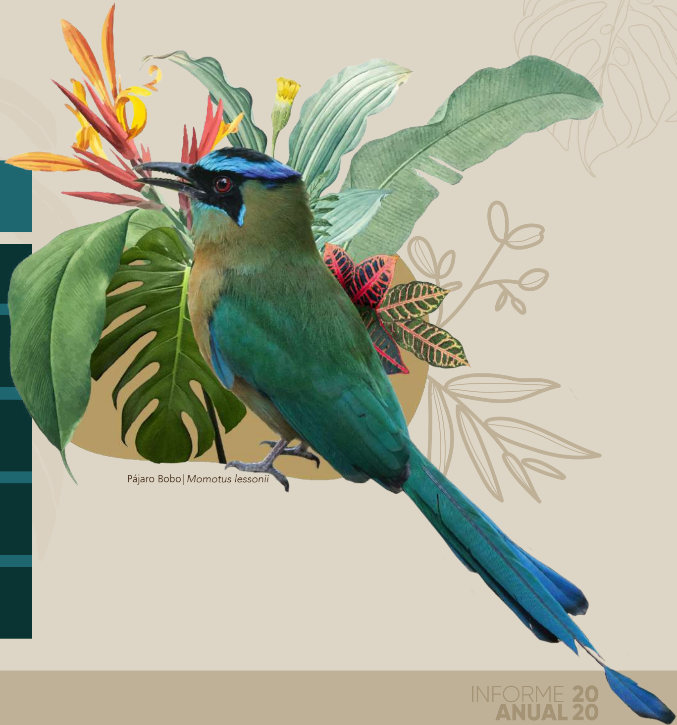
Pájaro Bobo | Momotus lessonii