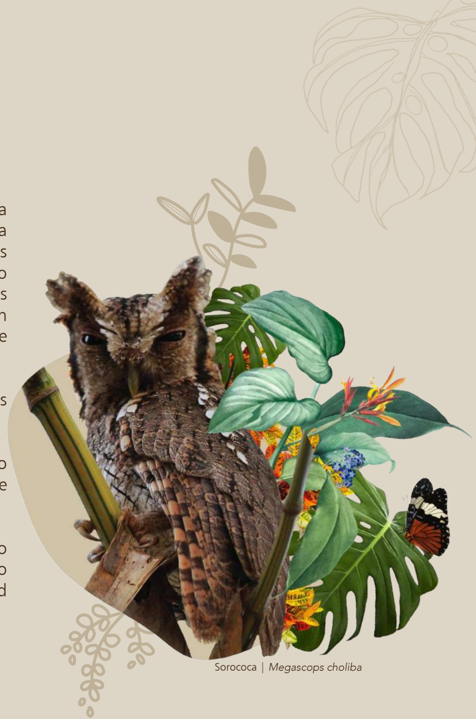
Sorococa | Megascops choliba

Los invitamos a estimular sus sentidos recorriendo nuestros jardines, observando aves y encontrando flores alrededor de todas nuestras áreas verdes, no solo como un espacio positivo para la familia sino también como proceso de salud mental y reinserción paulatina después de lo acontecido.