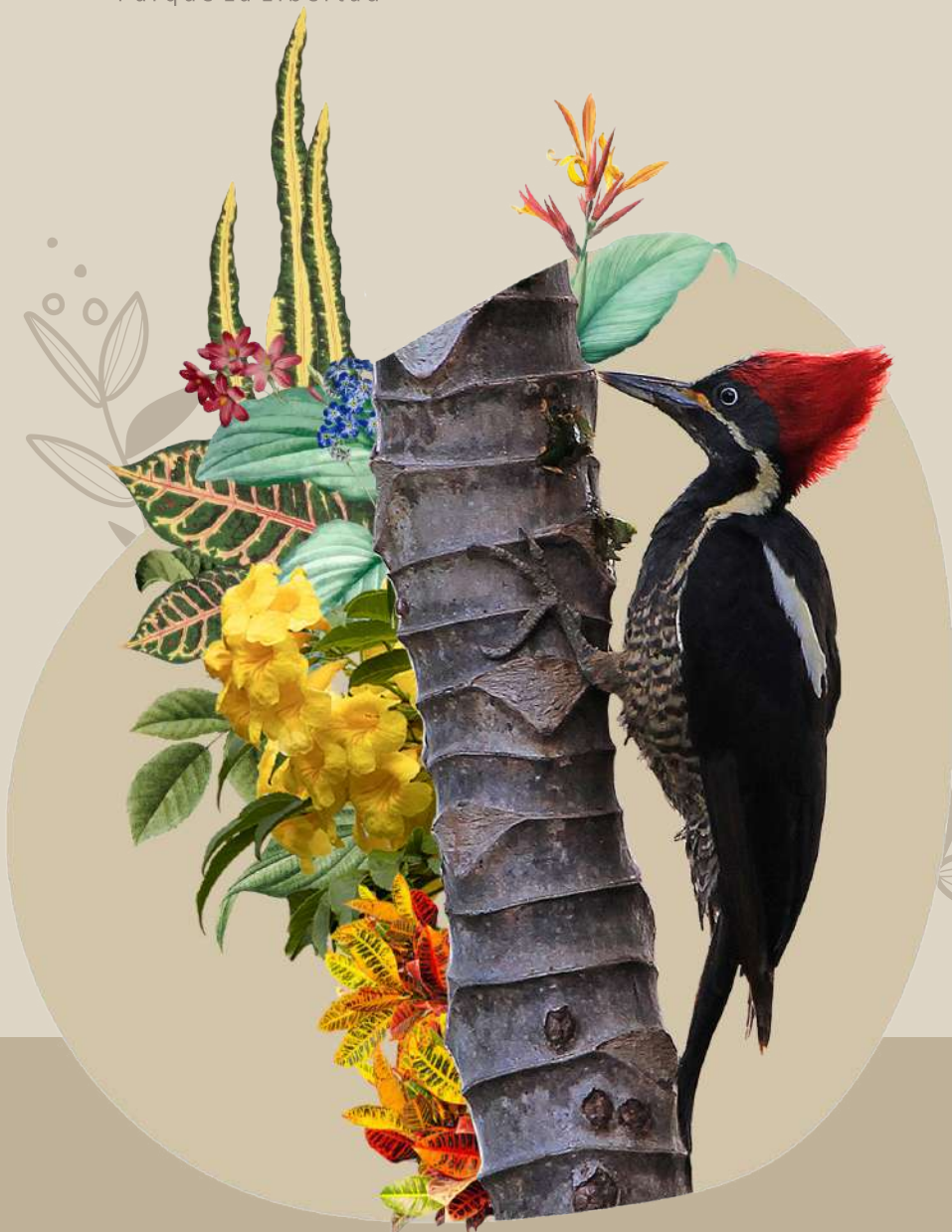
Carpintero Lineado | Dryocopus lineatus