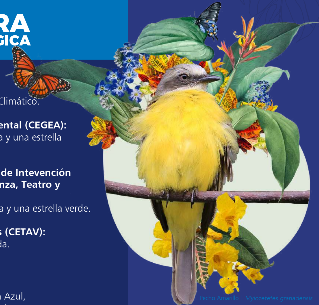
Pecho Amarillo | Myiozetetes granadensis

Implementación del programa: Categoría de Hogares Sostenibles Bandera Azul, participaron 10 familias y 2 fueron premiadas.