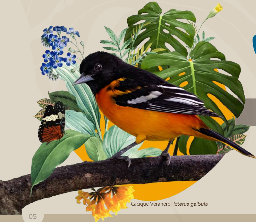
Cacique Veranero | Icterus galbula